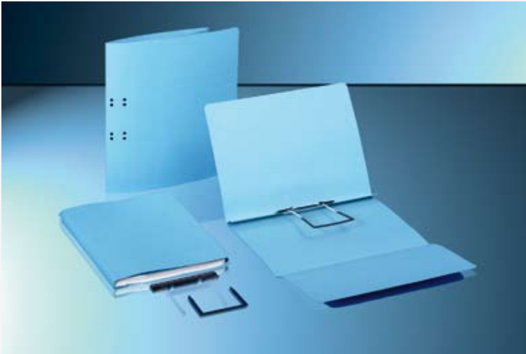
Archivhefter mit rechter Klappe und Archivschlauchheftung